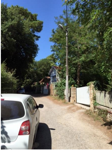
Eclairage avenue Adelaïde / Mercier