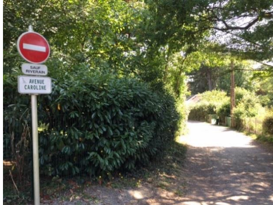
Avenue Caroline (Cavaro)