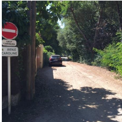
Avenue Caroline (Chênes verts)