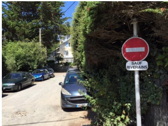
Avenue Marguerite Mercier